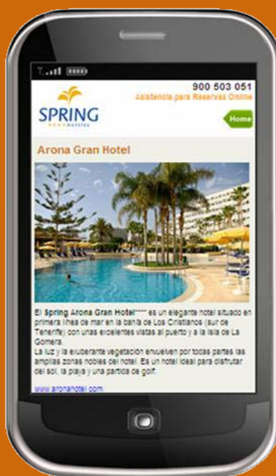
Ejemplo de proyecto real con Spring Hoteles

E n respuesta al incremento de navegación utilizando dispositivos móviles como iPhone, BlackBerry o dispositivos Android, recomendamos optimizar, con temas y apps ad hoc para mejorar la experiencia del usuario final a la hora de encontrar productos o navegar por las categorías de la tienda.